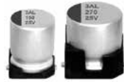
表示色: ケース頭部に青色印刷