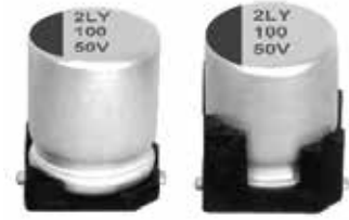
表示色: ケース頭部に青色印刷